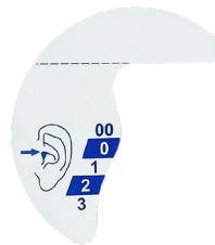
▲ 왼쪽 귀자